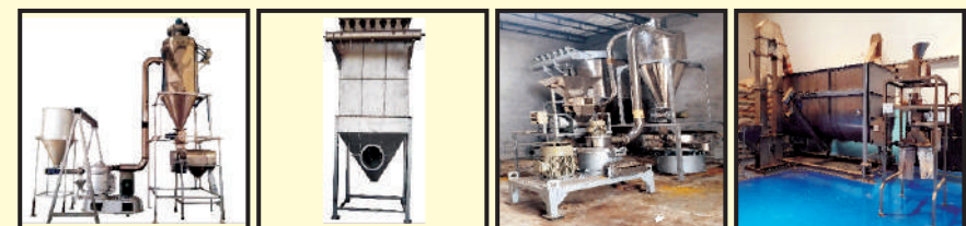
ULTRA FINE GRINDING