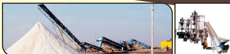
SALT WASHERY PLANT

LUMP CRUSHER, HAMMER CRUSHER, PIN MILL, IMPACT MILL, ULTRA FINE MILL VIBRATING SCREEN, ROTARY SIFTER, SCREW CONVEYOR, BELT CONVEYOR